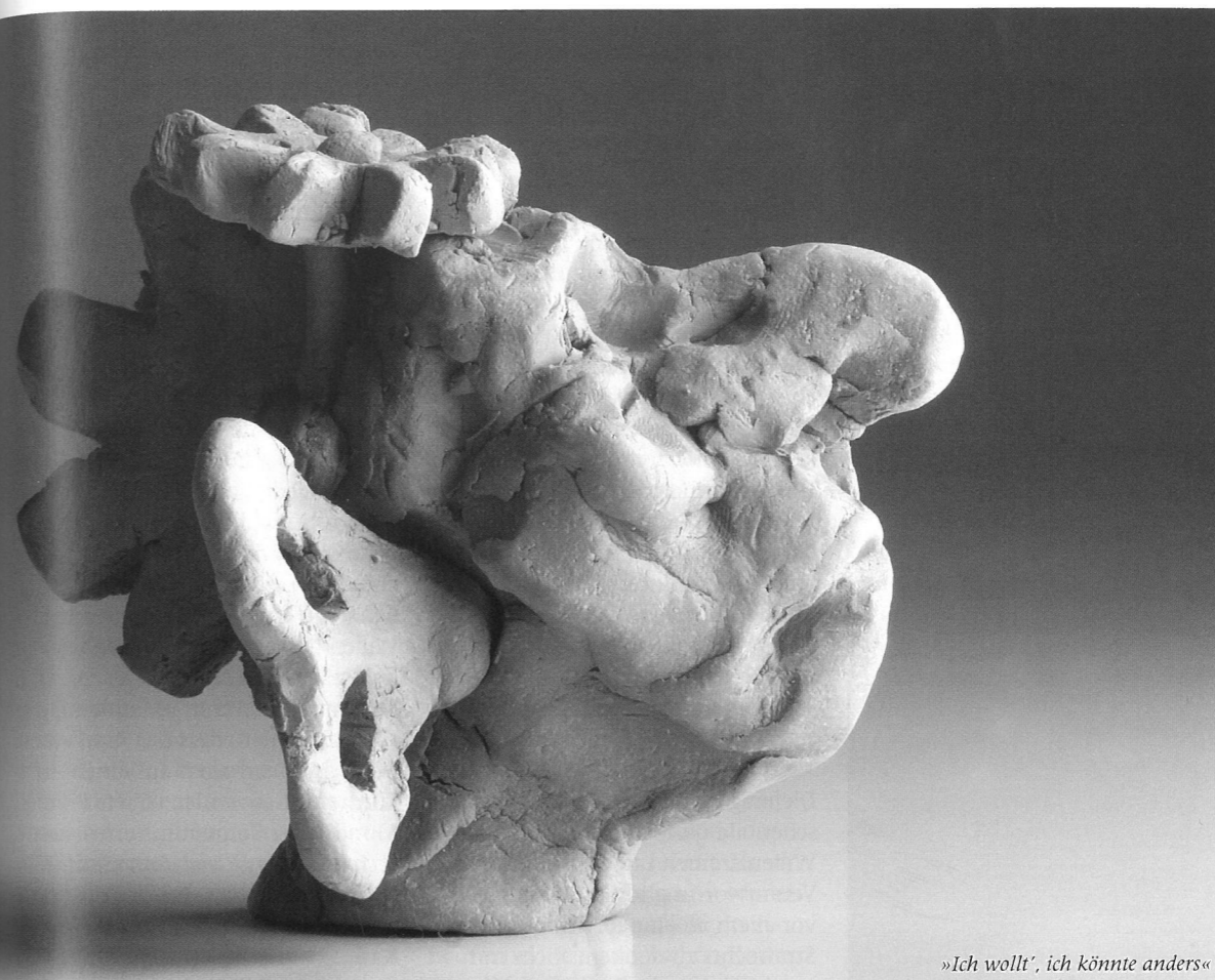
»Ich wollt', ich könnte anders«

Warum die Hirnforschung die Willensfreiheit nicht in Frage stellen kann