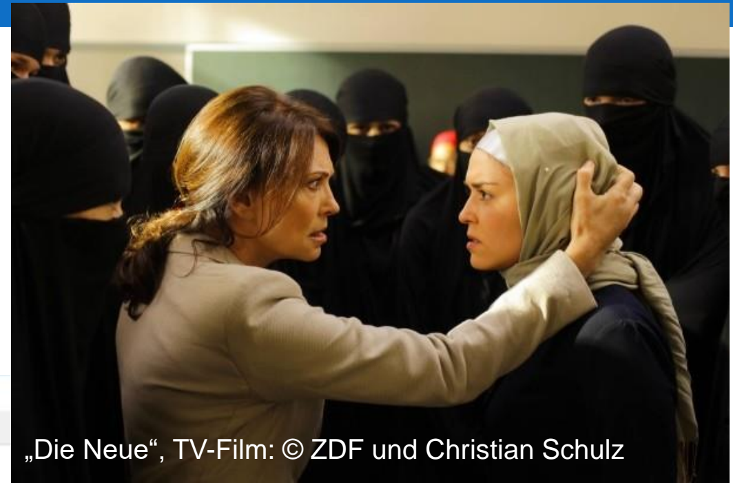
„Die Neue“, TV-Film: © ZDF und Christian Schulz